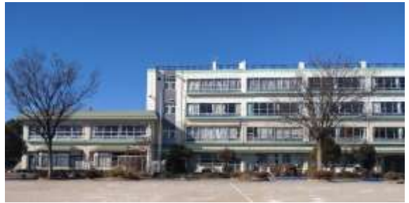
令和7年1月1日の東小

さて、本日から3学期がスタートしました。1月は「行く」、2月は「逃げる」、3月は「去る」と言われるように、3学期は、慌ただしく過ぎてしまう印象がありますが、学年のまとめと同時に次の学年の準備をする大切な時期です。子どもたち一人一人が、自信を持って卒業・進級の日を迎えられるよう、充実した教育活動を展開してまいりたいと考えております。