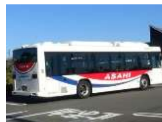
貸切バス(チャーター便)

11月13日（水）に市内音楽会が北本市文化センターで開催されました。本校から徒歩で文化センターに向かう場合、中山道から郵便局前の陸橋を渡る道のりで約3km、片道1時間弱かかります。本校では PTA に助成いただき、バスを手配し、東小専用貸切バスで文化センターに行きました。おかげさまで、児童は移動で疲れることなく、練習の成果を十分に発揮することができました。